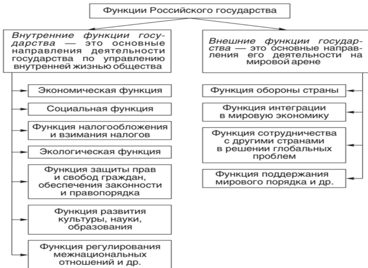
Пример схемы «Функции государства»