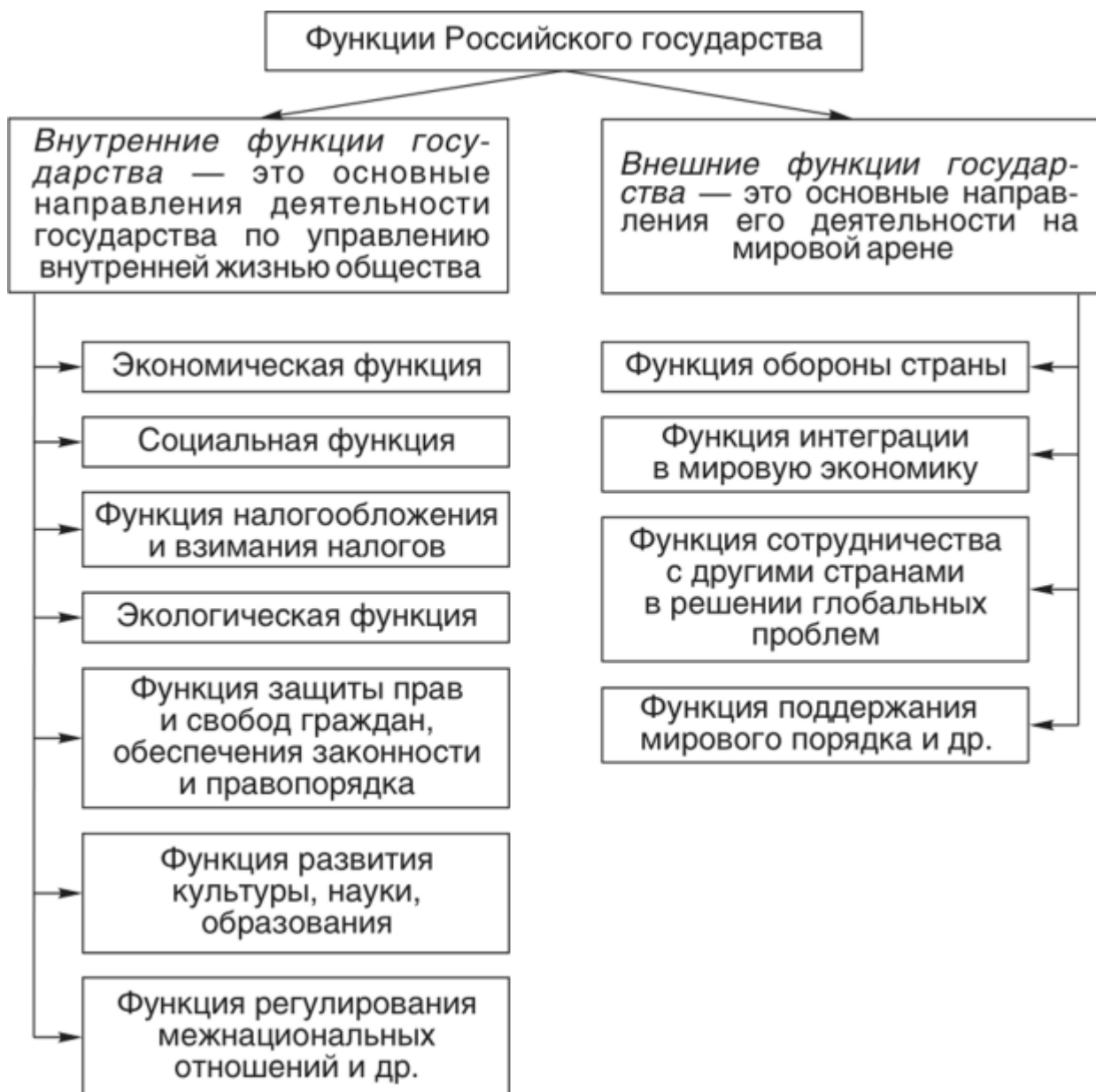
Пример схемы «Функции государства»